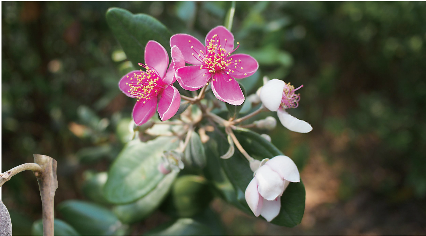
山捻子的花。

在海南，这个季节正是桃金娘开花结果的时节。踩着夏天的步伐，桃金娘已悄然将花朵和果实缀满田野乡间，趁着天气晴好，出门，采果子去。