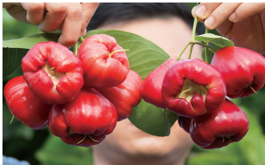
桃金娘科莲雾。

“于是乎卢橘夏熟，黄甘橙棣，枇杷燃柿，亭奈厚朴，栲枣杨梅，樱桃蒲陶，隐夫羹棣，答查离支，罗乎后宫，列乎北园。”《上林赋》列举的这一系列水果中，就有人认为其中“蒲陶”是指蒲桃。■