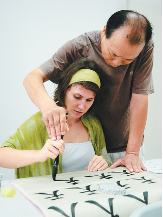
海南大学教师教国际学生写书法。

笔者从6月20日在省教育厅召开的新闻发布会上获悉:经过多方不懈努力,我省终于实现了中外合作办学机构零的突破——2017年5月4日海南大学亚利桑那州立大学联合国际旅游学院获得教育部批准设立,并将于今年实现正式招生。