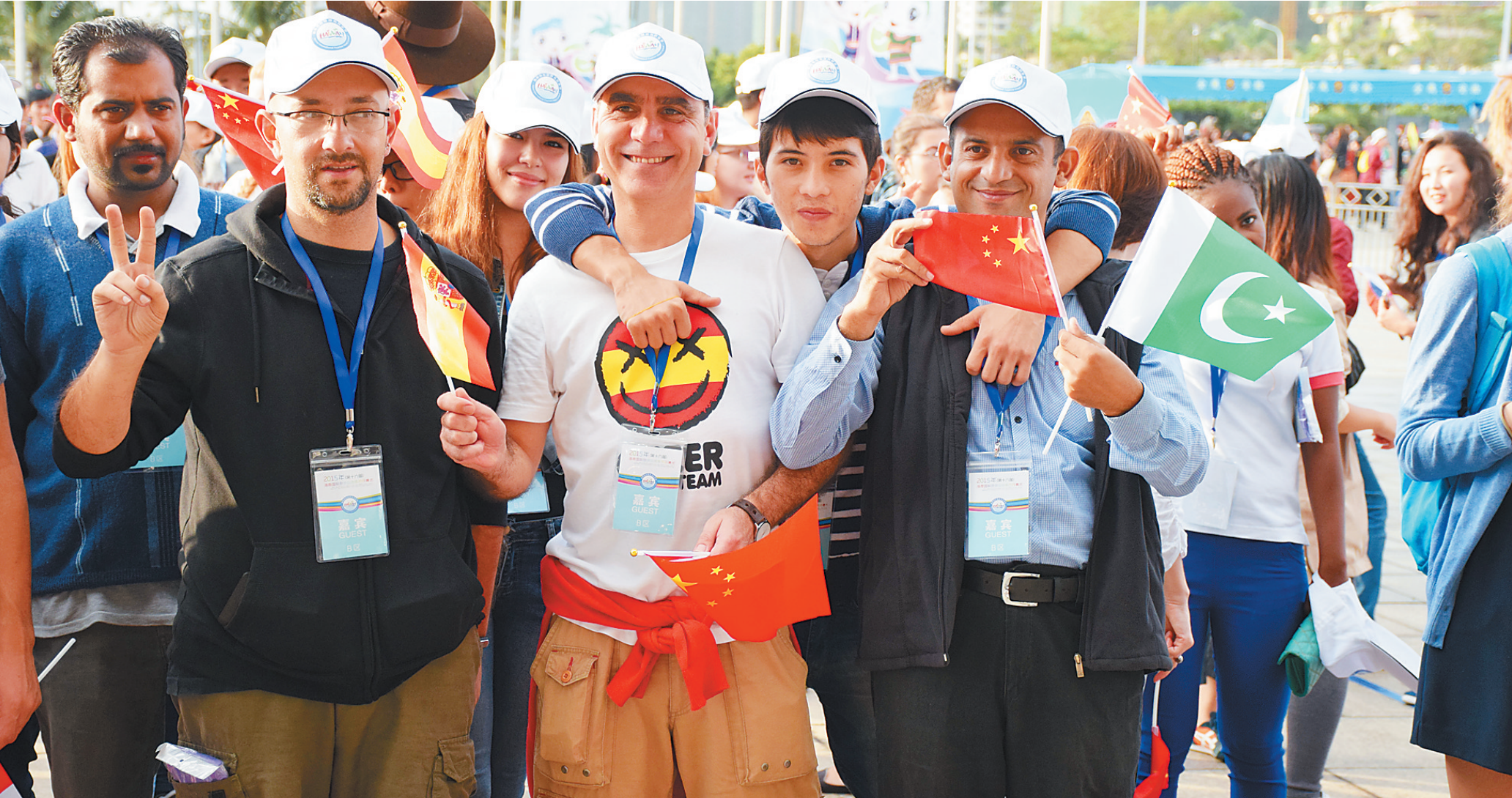
海南大学国际学生参加2015年海南国际旅游岛欢乐节开幕式活动。