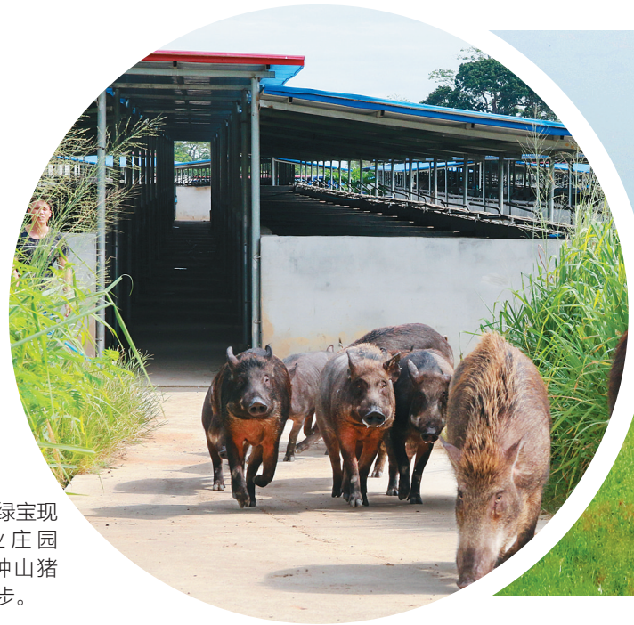
玉绿宝现代农业庄园内,特种山猪悠闲散步。