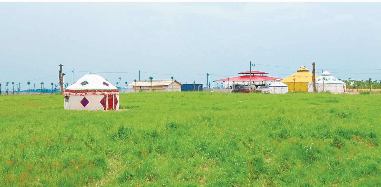
雪古丽农牧生态经济共享农庄,犹如青青草原。

位于海南岛西部的昌江黎族自治县,属典型的热带季风气候区,寒害少风灾轻,光照充足,非常适合发展热带特色高效农业。近年来,昌江不断推进农业供给侧结构性改革,着力做优做特冬季瓜菜等“五大种植产业”,霸王山鸡等“六大养殖产业”,推动农业转型升级。 同时,昌江着力培育和扶持农民专业合作社、家庭农场、农业龙头企业等新型农业经营主体,推动特色产业基地发展。此外,还积极引进和培育了桑蚕、辣木、火龙果、莲雾、冰糖蜜瓜等一批新特优品种,创建了昌江芒果、香水菠萝、姜园圣女果等一批具有地方特色的优质农产品和省内外知名品牌。 目前,昌江全县共有农民专业合作社250家,家庭农场166个,农业龙头企业6家,较大规模特色产业基地(500亩以上)53个,较大规模的特色养殖基地13个,较大规模立体发展的生态循环农业基地3个,注册农产品商标92件,全