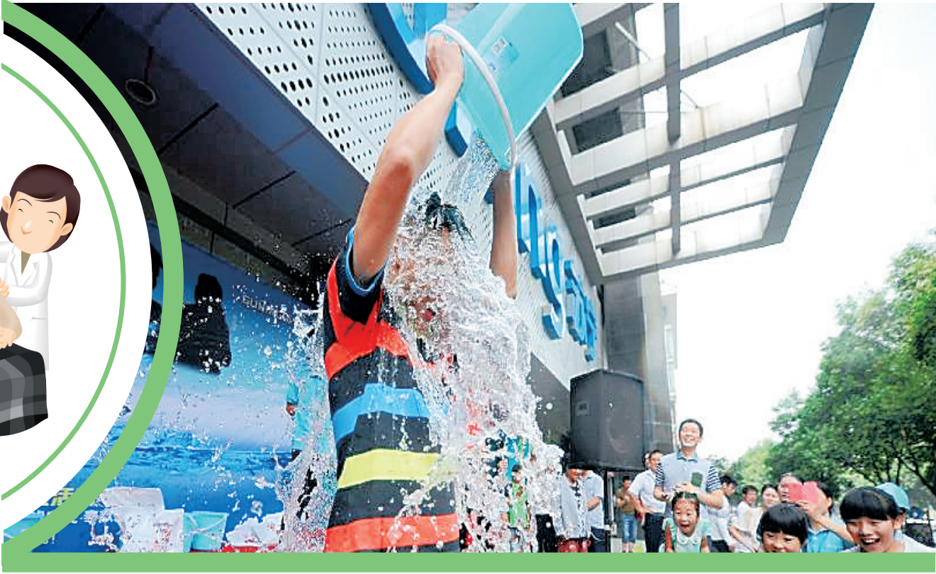
爱心志愿者参加“冰桶挑战”活动。“冰桶挑战”由美国一名棒球运动员发起，旨在唤起公众对“渐冻人症”患者的关注。