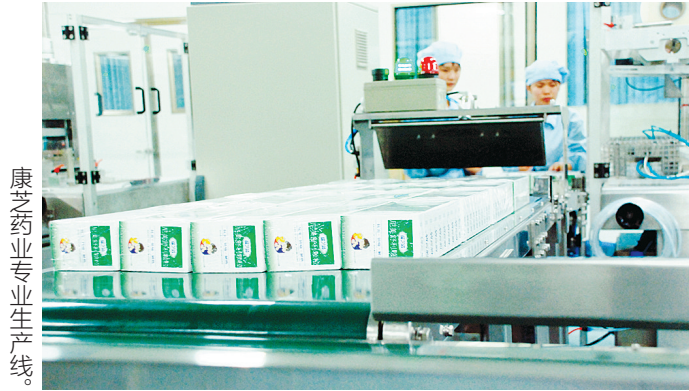
康芝药业专业生产线