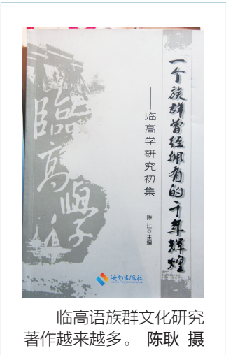
临高语族群文化研究著作越来越多。

现年80岁高龄的著名学者叶显恩,是我国明清经济史方面的专家、现代中国三大显学之一的“徽学”学科的开创者和奠基者(另外两大显学为“藏学”和“敦煌学”)。叶显恩虽然长期工作和生活在广州,但对家乡海南临高一往情深。他积极倡议建立“临高学研究会”,开展“临高学”研究,以丰富海南地域文化内涵,并四处奔走呼号,身体力行,翻阅大量历史典籍,访问海南文化历史方面的专家学者等。他是第一个对临高语族群在海南历史上的贡献问题作出高度评价的学者。 叶显恩说,打开海南地图,临高这个位于西北部的农业县,也许并不显眼,但这里的资源丰富,海岸线长,土地肥沃,是海南重要的“粮仓”和“鱼米之乡”。他表示,“临高学”将是以前高语族群为研究对象的一门综合性学科,因而其研究范围就不仅限于临高县,而是以南渡江以西操临高语族群居住的地域为主,也涉及环岛的其它沿海地区,目前其人口约有100万,占海南总人口的1/8。 叶显恩认为,文化是社会经济发展的“根”,不重视文化建设,社会经济的发展就会失去根基,就不会有厚实的底蕴。目前,海南国际旅游岛的建设正在深入展开,研究海南历史,丰富海南文化,显得非常重要和迫切。他说,目前海南古代历史研究还相当薄弱,需要进一步加强。 在谈到作为海南文化重要组成部分的“临高学”研究时,叶显恩说,这是一个尚待开掘的区域性文化宝库。虽说临高是个小地方,但临高的历史悠久,与海南古代历史发展息息相关,因而小地方可以反映大文化。 他指出,过去许多人只知道黎族是进入海南岛最早的族群,尔后是闽南人,却很少有人知道临高语族群是继黎族之后,闽南人之前第二个登岛的族群。至于临高语族群在海南历史上的重要地位和作用,知道的人就更少了。其实,临高语族群曾经影响海南一千多年的文化历史,具体地说,至少自汉代以后,至宋代以前的海南,临高语族群处于重要的地位。 临高语族群对开发海南岛、维护南海主权,以及开辟海上丝绸之路等方面,都做出了不可磨灭的贡献。其值得称颂的辉煌历史,长期以来被覆盖,被湮没了。今天,我们发掘临高人的历史,重现临高语族群的光辉业绩,还原海南的历史进程,对于建设海南文化软实力,实现文化自觉、文化自信和文化自强,都具有重要的现实意义。