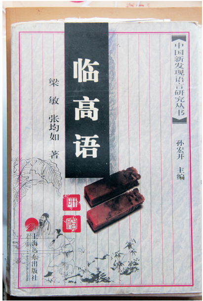
部分研究临高语的学术著作。