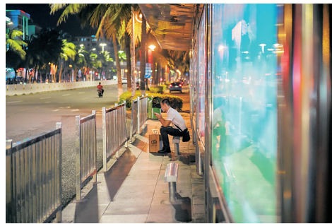
凌晨1点25分 夜1线友谊站，小高一边玩手机一边等车。