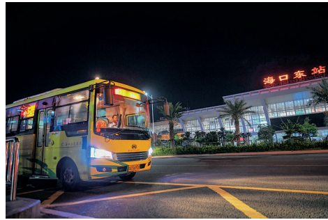
凌晨2点20分 海口东站，夜线3线公交司机在等“熟悉”的乘客上车。