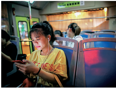
机，她也是偶尔有事才坐夜线车。