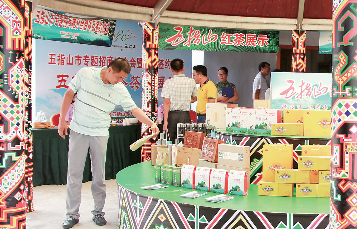
➔ 6月26日，五指山专题招商推介会上，五指山红茶展示区吸引宾客驻足。

“在全省看来，五指山市推出的招商项目不多，投资额度也不大，但我们推出的项目较为成熟，项目落地性强，同时我们做好相关服务，让企业在开发中无后顾之忧。”陈振聪表示。