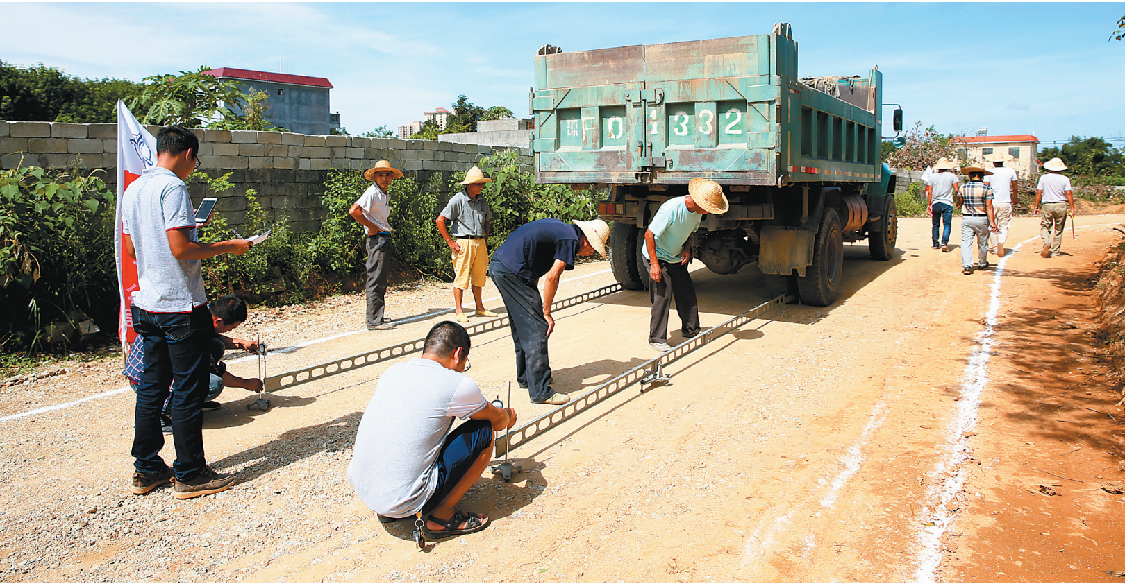
6月22日，工程技术人员正在儋州市和庆镇和合村验收1.4公里村路路基。