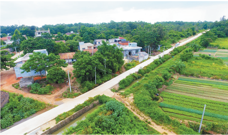
临高县临城镇临加线至头板村1.727公里村路已完工。

而随着杨梅村村路硬化工程的逐步实施，村民们的生产经营方式也发生了重大变化，打破了传统的水稻单一种植模式，形成以连片瓜果种植为主、水稻粮食生产为辅的经营模式。