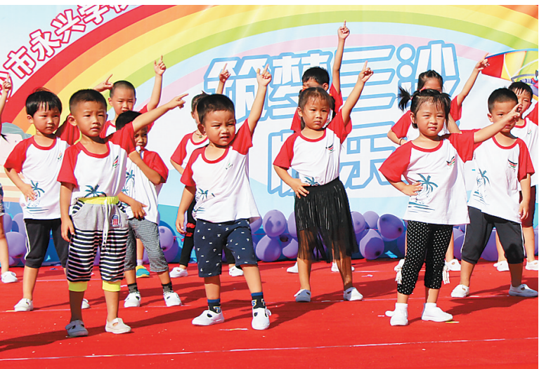
排练节目是支教老师的必修课。

老师们每个学期都要进行家访，把班上的每个孩子都家访到。此外，她们还要到赵述岛、北岛等其它岛上去送教，并动员适龄的孩子入学，通过问卷的形式询问他们对学校有什么