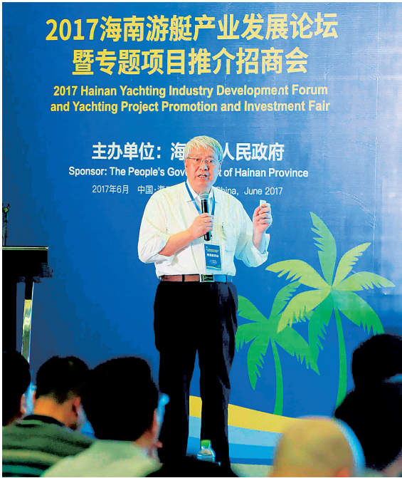
6月28日,在2017海南游艇产业发展论坛暨专题项目推介招商会上,与会嘉宾介绍游艇产业发展前景。