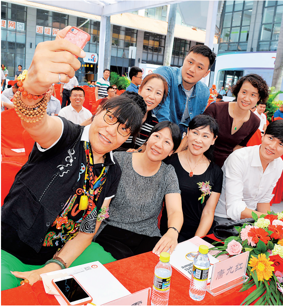
6月28日,海南萨拉坦体育与易建联薪火阵营签约仪式在海口文化产业园举行,多位体育名将出席活动。