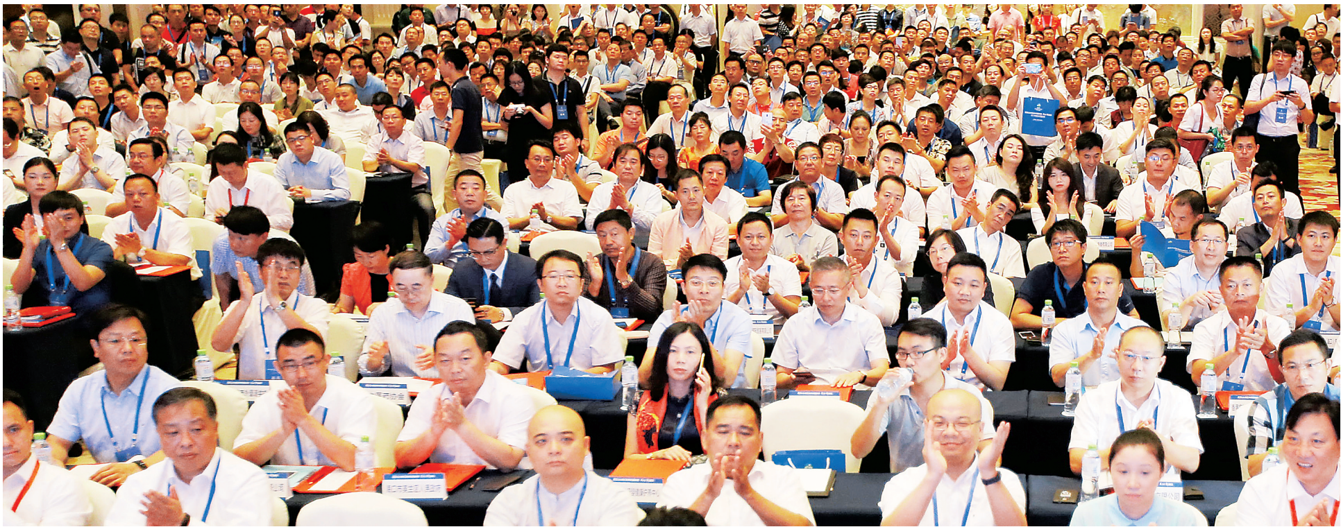
6月27日,2017海口综合招商推介大会举行,来自国内外的客商相聚椰城,寻找投资新机遇。

仲夏琼岛,迎八方宾朋,聚天下客商。以“美好新海南 投资新机遇”为主题的2017海南综合招商活动自6月27日启动以来,海南以其更具活力、更加自信的新形象,让广大投资者切身感受投资海南的新机遇,点燃了中外客商的投资热情。宾客们聆听海南招商计划,畅谈合作共赢愿景,为加快建设美好新海南献智出力。