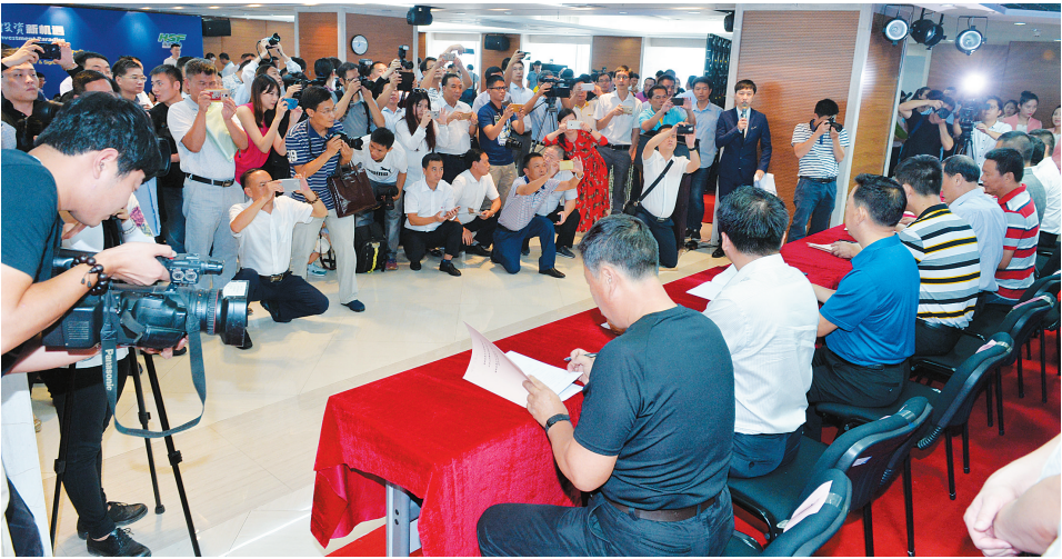
6月27日,2017海南农垦招商推介会暨签约仪式在海垦国际金融中心举行。