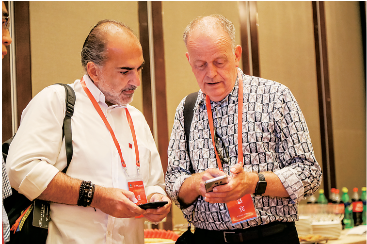
6月28日,境外企业合作交流会上,与会嘉宾相互交流。