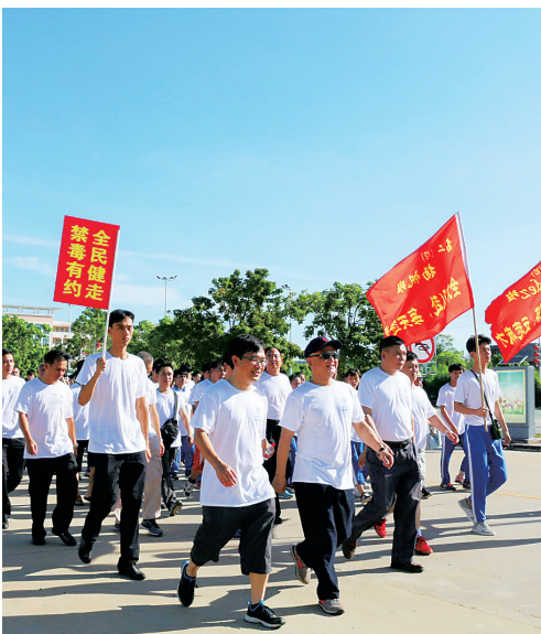
健走队伍手举禁毒宣传牌和彩旗,向群众宣传禁毒知识。

健走队伍手举禁毒宣传牌和彩旗,健走路线旁悬挂着禁毒宣传横幅,禁毒宣传氛围浓厚,对提高广大人民群众拒毒、防毒意识有积极作用。据了解,自22日起,白沙已开始举办一系列禁毒宣传活动,并深入各乡镇及农场开展形式多样的禁毒宣传活动,在全县范围内举办“6·26”国际禁毒日“全民禁毒宣传月”主题活动,共同营造禁毒、防毒、拒毒的宣传氛围。