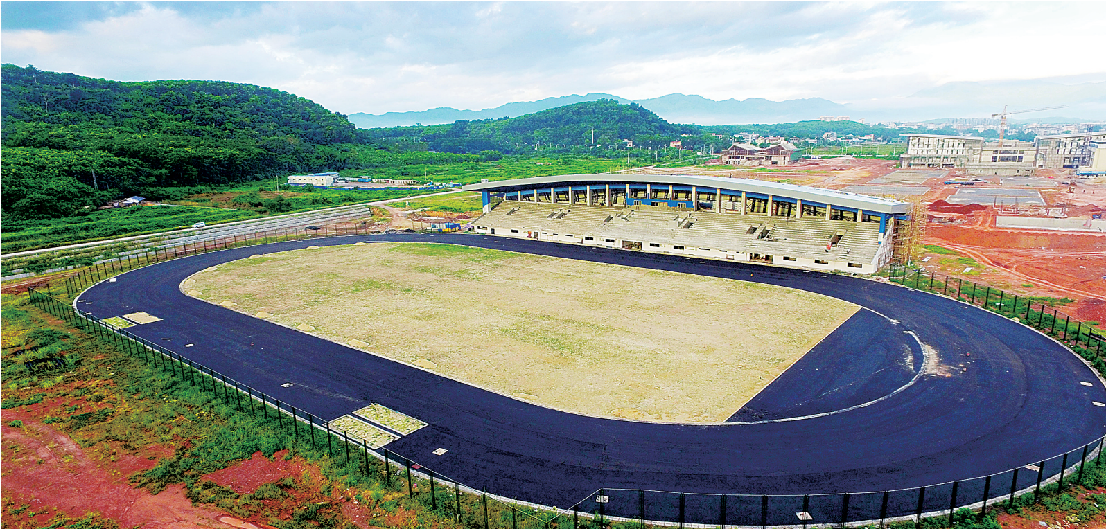
白沙文化体育运动中心田径运动场项目建设已完成工程量的95%。

近年来,白沙不断加快推进重点项目建设,在重大项目的有力推动下,进一步完善全民健身服务体系,通过基础设施建设满足群众体育文化生活需要。