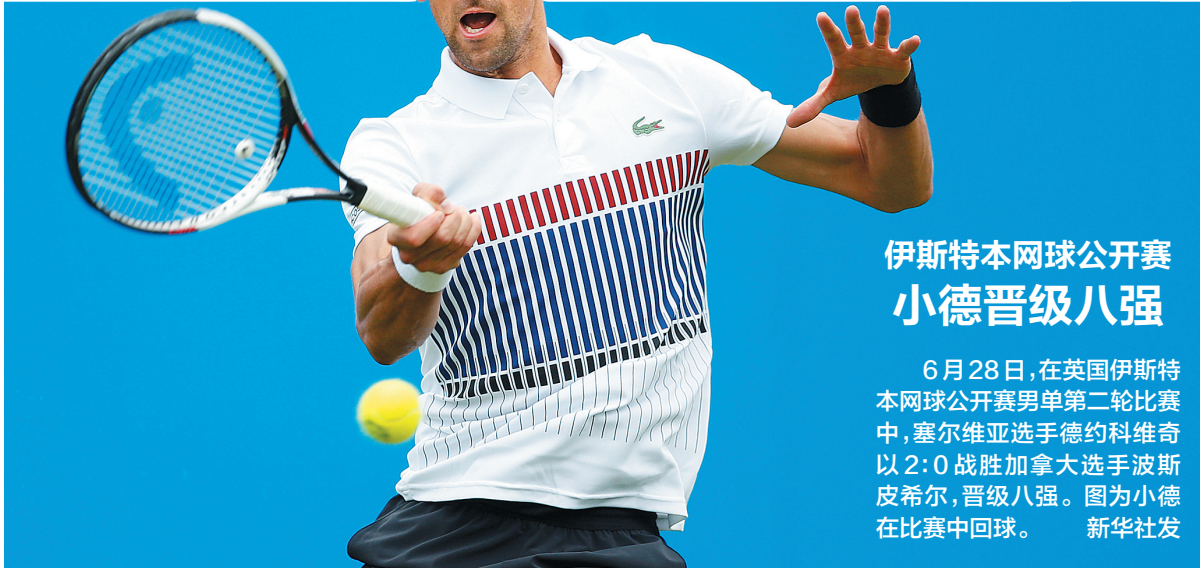
伊斯特本网球公开赛 小德晋级八强

墨西哥在小组赛的战绩也是两胜一平，但因为净胜球的劣势，位列葡萄牙之后排名小组第二。墨西哥是本届联合会杯的“逆转王”，小组赛3战均在落后的情况下逆转获胜或者扳平。这支墨西哥队不仅有细腻的技术，斗志还十分顽强。德国战车以钢铁意志著称，但未必能轻松越过老辣又坚韧的墨西哥队。 ■ 林永成