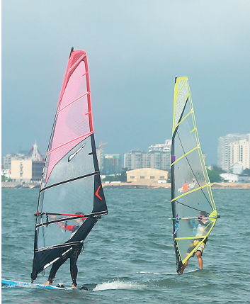
海口西海岸，几位市民起帆冲浪。

上按照世界著名的拉玛西亚青训标准培训进行。 省文体厅相关负责人表示，中国足协、省文体厅、海口市政府有意将中国足球南方训练基地打造成亚洲著名的冬训基地，与日本冲绳、阿联酋迪拜比肩。该基地能提高海南在国际上的知名度，吸引亚洲和欧洲等足球“豪门俱乐部”来海南冬训，让更多的国外球迷知道海南。目前，欧洲德、西、法、意和英五大联赛除了英超外，每年冬天都有3周左右的“冬歇期”。像拜仁慕尼黑队、皇家马德里队、尤文图斯、AC米兰等国际顶级豪门俱乐部在“冬歇期”时常会选择气候温暖的迪拜训练。这些俱乐部的拥趸遍及全世界，俱乐部到哪里，这些球迷经常会跟到哪里。假如过几年，这些全球著名的球队来海口冬训，到那时，海南会经常出现在国际主流体育媒体的头条，海南的美丽风光会通过大牌球星和教练的社交媒体迅速传播开来。