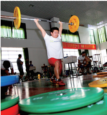
2015年，国家队举重运动员在五指山奥林匹克体育训练基地训练。