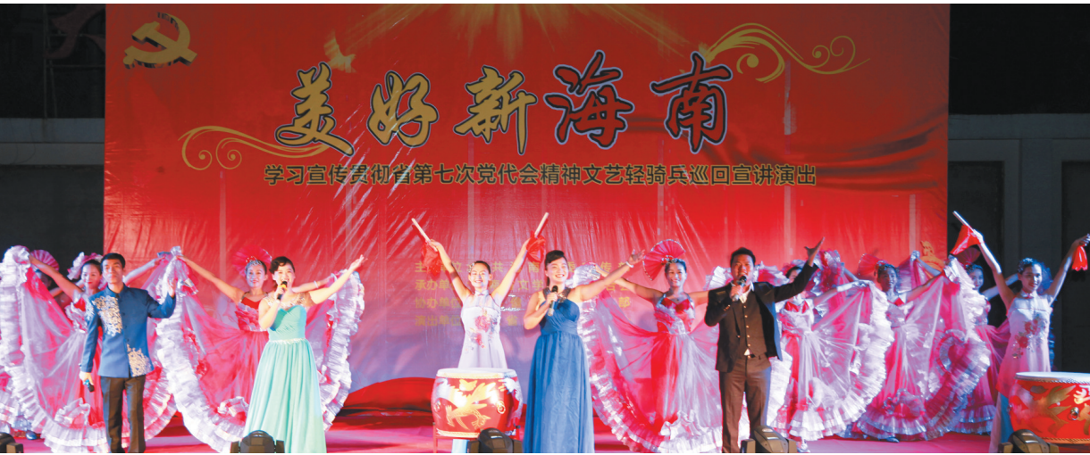
六月二十七日晚，在儋州市兰洋镇举办的贯彻落实省第七次党代会精神文艺轻骑兵巡回宣讲演出活动现场。

多个市县干部群众反映，省第七次党代会精神文艺轻骑兵巡回宣讲以新颖的演出方式，紧密结合省第七次党代会报告内容，让省第七次党代会精神家喻户晓、入脑入心，在各地持续掀起了学习宣传贯彻省第七次党代会精神的新高潮，进一步提升了全省人民加快建设美好新海南的精气神。