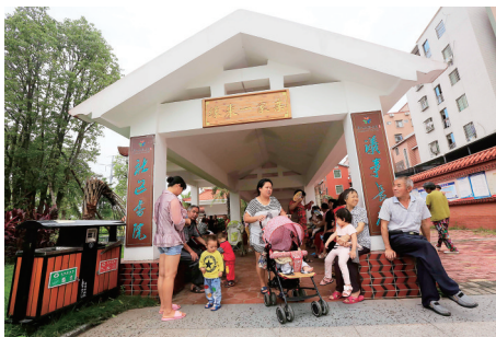
厦门市同安区新民镇梧侣社区。