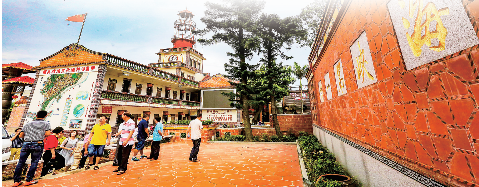
晋江市金井镇围头村。