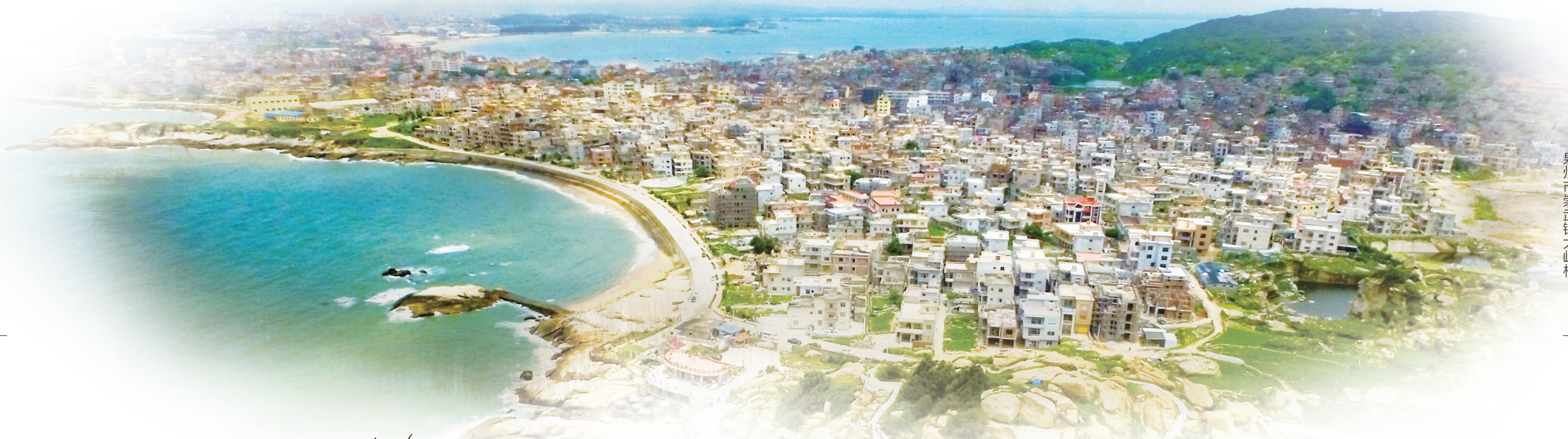
泉州市崇武镇大岞村