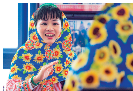
身着传统服饰的惠安女。