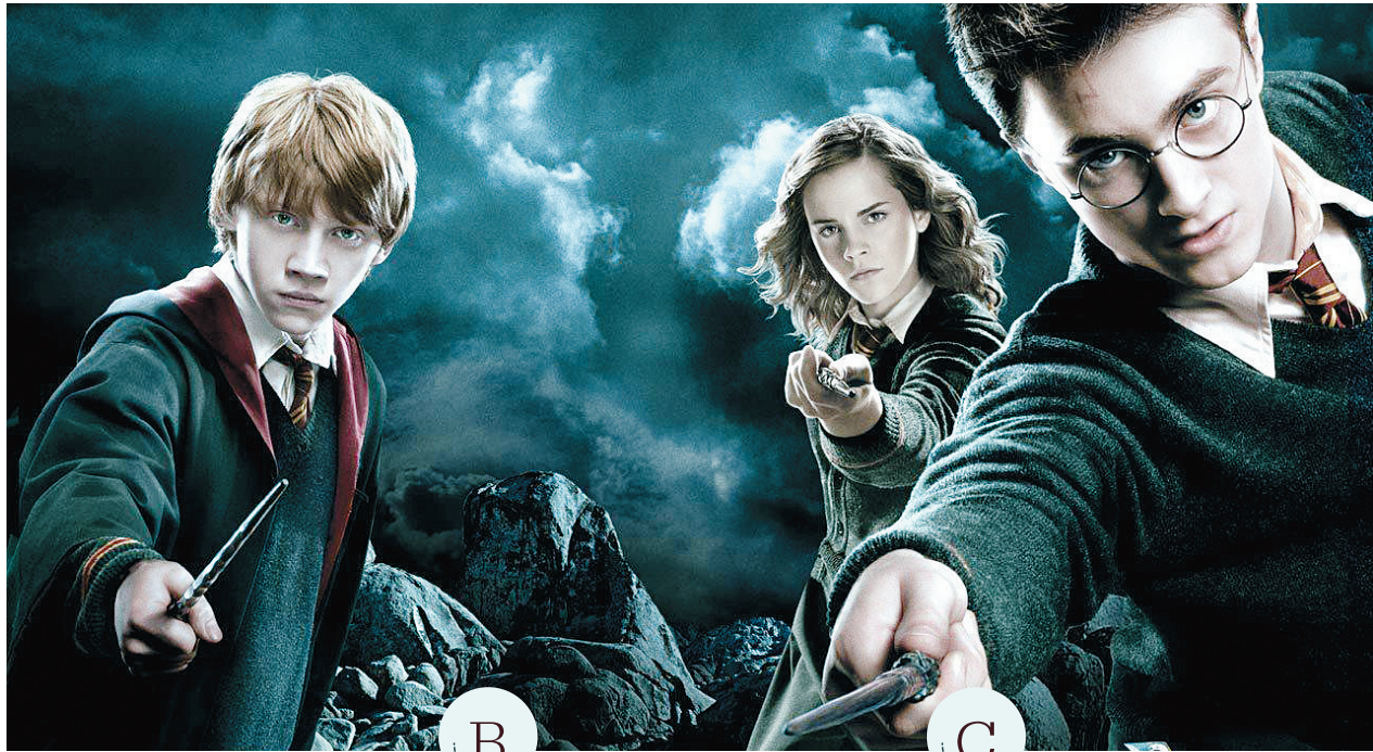
哈利·波特系列电影剧照