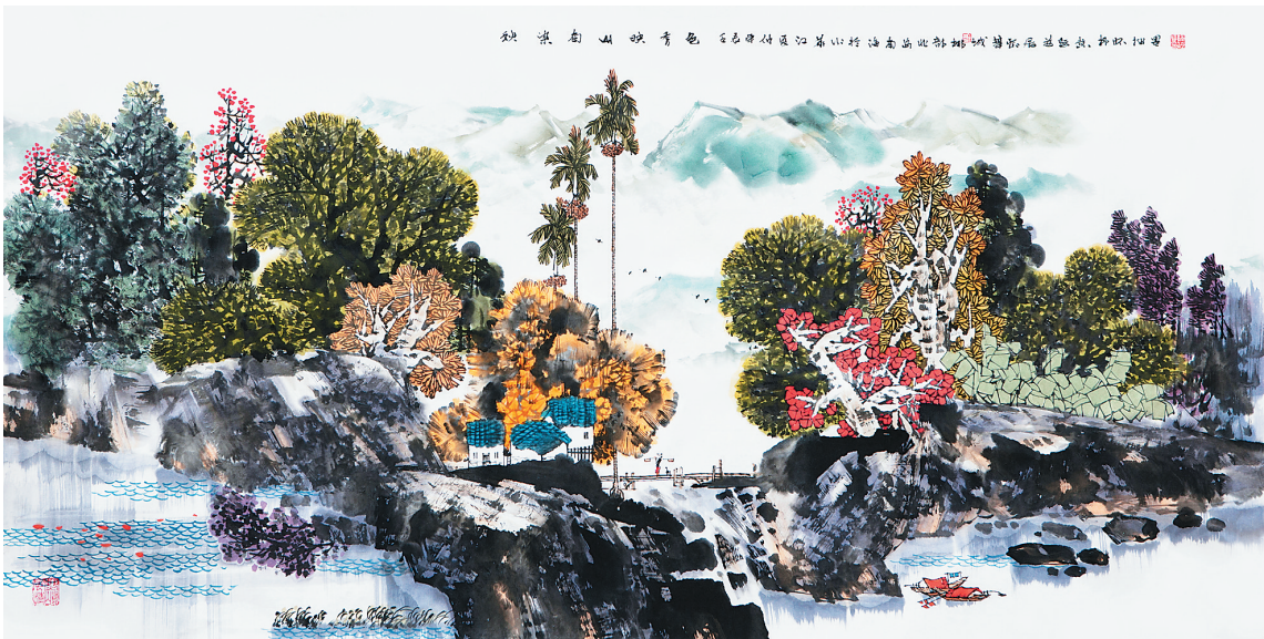
《秋染南山映秀色》(国画) 阮江华

近年来,海南书画家一方面不断走出去,一方面不断将省外优秀作品请进来,通过艺术交流,能够在尺幅之间,砥砺前行,取长补短,进一步增进省内外艺术家之间的了解和友谊,促进和繁荣两地艺术创作水平。