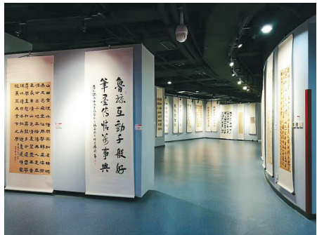
山东海南书法联展现场。