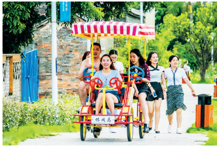
洁净秀美的南宁市忠良村吸引了很多游客。