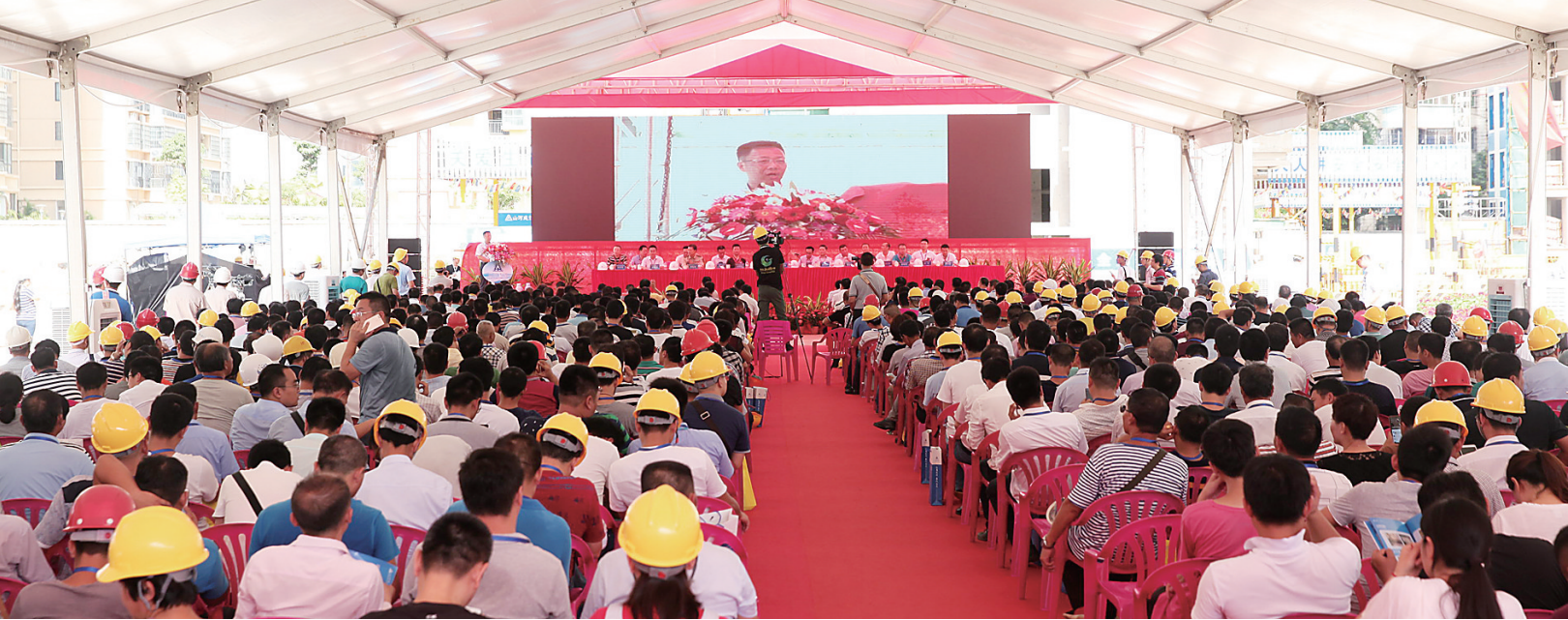
2017年省级建筑施工质量安全标准化现场观摩会。