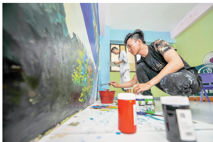
“兄弟俩”绘制壁画乐在其中。