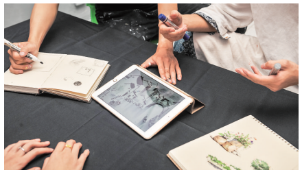
兄弟俩向雇主推荐自己的壁画作品。