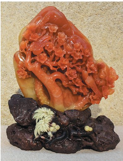
昌江玉雕《木棉花开》周金甫 作