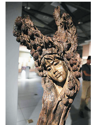
木雕《黎族五方言》黄黎祥 作