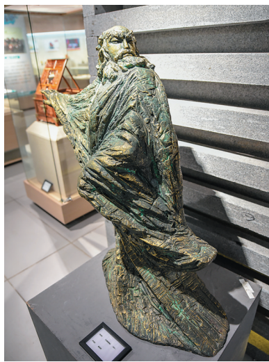
铜雕《玉蝉渡海》程连仲 作 本报记者 袁琛 实习生 陈斯华 摄