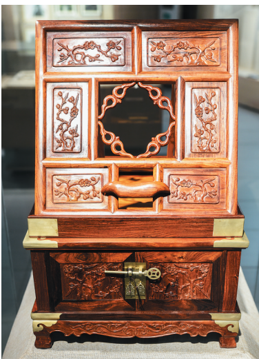
《黄花梨梳妆台》冯运天藏品