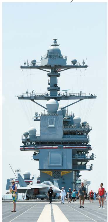
7月22日,在美国弗吉尼亚州诺福克海军基地,游客在“福特”号航母上参观。

特朗普就任总统后,于今年3月接受《时代》周刊采访时对“福特”号的电磁弹射器表示了不满,称这套系统“额外耗资上亿美元却不好用”,应该退回到蒸汽弹射技术。