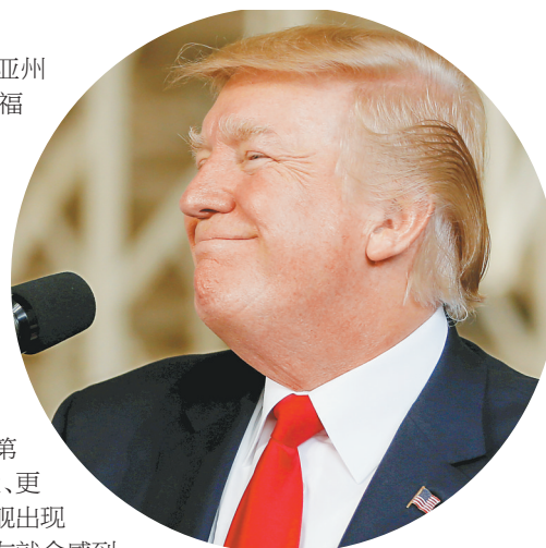
7月22日,特朗普出席“杰拉尔德·福特”号航空母舰服役仪式。