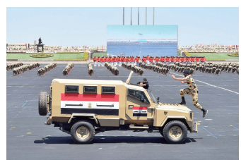
7月22日,在埃及地中海滨城市亚历山大以西的哈马姆,军校学生在穆罕默德·纳吉布军事基地启用典礼上展示技能。

另据当地媒体报道,穆罕默德·纳吉布军事基地将成为埃及及北部部分部队的指挥中心,负责保卫亚历山大、北部海滨、在建核电站、油田等地点。基地还将用于埃及和其他国家军队的军事训练。