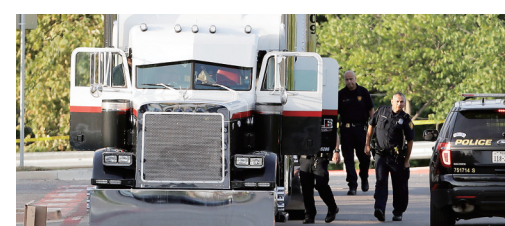
7月23日,在美国圣安东尼奥市,警察在涉事现场调查。

据报道,警方在一家沃尔玛超市的停车场内发现涉案车辆。除8具尸体外,警方还在货车内找到多名人员,并将受伤人员送往医院。目前,这辆货车的司机已被警方逮捕。