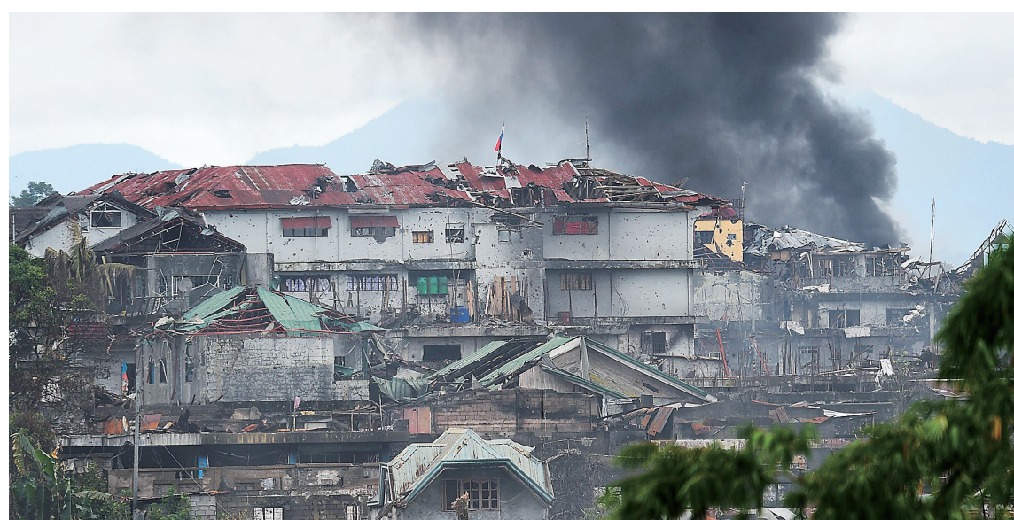
7月22日,一处建筑在菲律宾政府军空袭后冒出浓烟。

菲律宾总统发言人埃内斯托·阿贝拉本月18日透露,杜特尔特致信国会,希望国会批准把南部的戒严时间延长至年底。杜特尔特在信中写道,延长戒严旨在让菲律宾军警集中精力作战、不受戒严结束时间的影响。