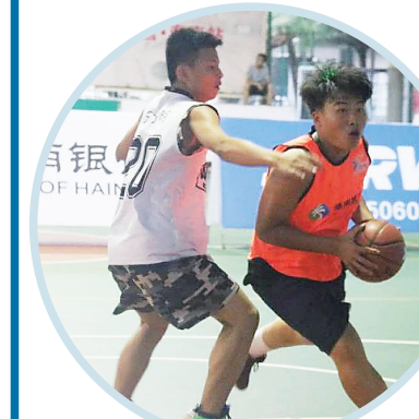
选手在三人篮球赛中