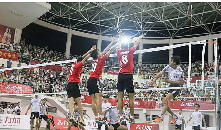
图为海师队和澄迈队(红衣)在比赛中。

本次比赛由海南省文体厅主办,海南省体育总会承办,定安县文体局、陵水黎族自治县文体局、屯昌文体局、琼海市体育管理局、文昌市体育管理局协办,喜力贸易(上海)有限公司洋浦分公司独家赞助。