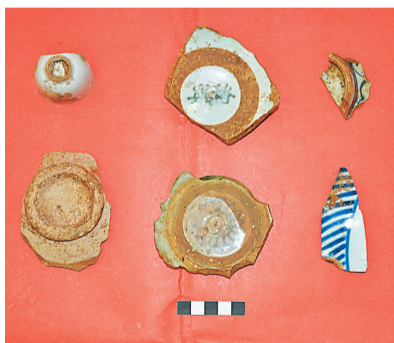
调查采集的青花碗、碟、粉彩杯瓷片。

一座千年的古寺在历史的长河中经历了多少次的劫难与重生我们不得而知,只能从零星的记载和残存的砖瓦碑石中寻找那段尘封的记忆。