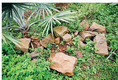
现场遗留的地基石。