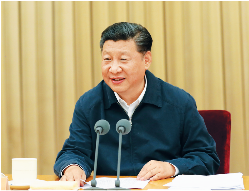
7月26日至27日，省部级主要领导干部“学习习近平总书记重要讲话精神，迎接党的十九大”专题研讨班在京举行。中共中央总书记、国家主席、中央军委主席习近平在开班式上发表重要讲话。

习近平强调，党的十八大以来5年，是党和国家发展进程中很不平凡的5年。5年来，党中央科学把握当今世界和当代中国的发展大势，顺应实践要求和人民愿望，推出一系列重大战略举措，出台一系列重大方针政策，推进一系列重大工作，解决了许多长期想解决而没有解决的难题，办成了许多过去想办而没有办成的大事。我们全面加强党的领导，大大增强了党的凝聚力、战斗力和领导力、号召力。我们坚定不移贯彻新发展理念，有力推动我国发展不断朝着更