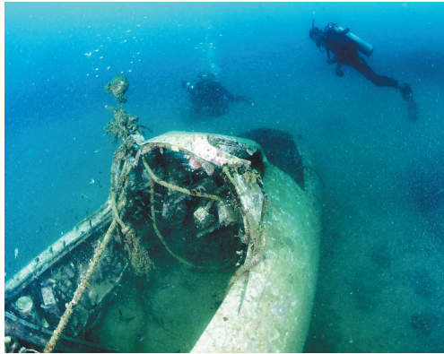
季军作品——沉落的飞机(盖广生)