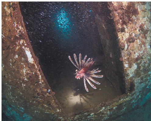
冠军作品——孤傲的狮子鱼(何凯东)