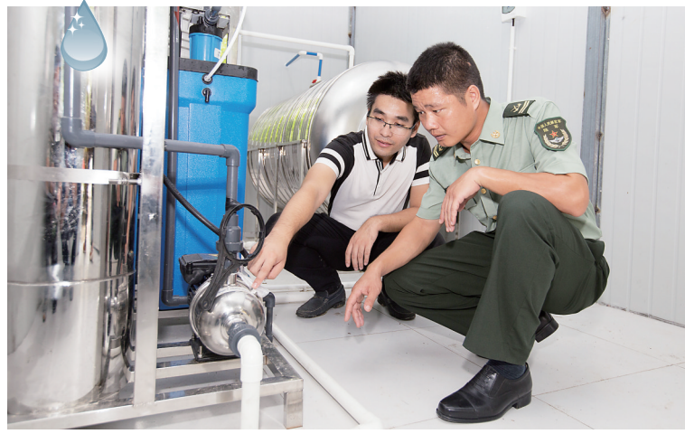
7月29日,三亚东瑁洲岛净水站,技术人员指导驻岛官兵使用净水设备。

本报三亚7月29日电(记者 袁宇)今天上午,三亚东瑁洲岛上举行了一场规模小却暖心的典礼。由三亚海上军事博物馆与驻岛陆军某海防连共建的净水站正式落成并投入使用。