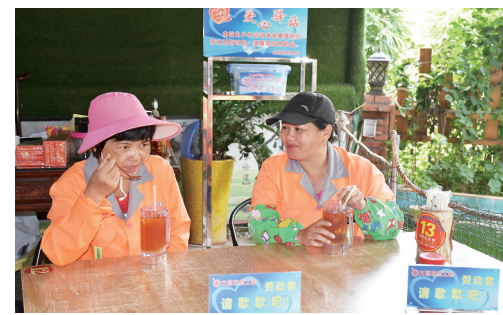
7月28日,两名环卫工人在爱心驿站喝冷饮休息。 见习记者 张期望 通讯员 吴芬蕊 摄

本报文昌7月29日电(见习记者张期望 记者许春媚 通讯员吴芬蕊)以后,天气实在太热的时候,我们有凉快的地方歇歇脚了。”7月29日上午,在文昌市文城镇教育路“喝茶大学城”茶店内,正在休息的环卫工陈大姐指着“爱心驿站”的牌子高兴地说。据了解,为方便当地环卫工人、出租车驾驶员、公交车司机、交通警察、快递员等户外劳动者在工作期间稍稍停顿休息,文昌目前已设立5家爱心驿站,免费供户外劳动者使用。