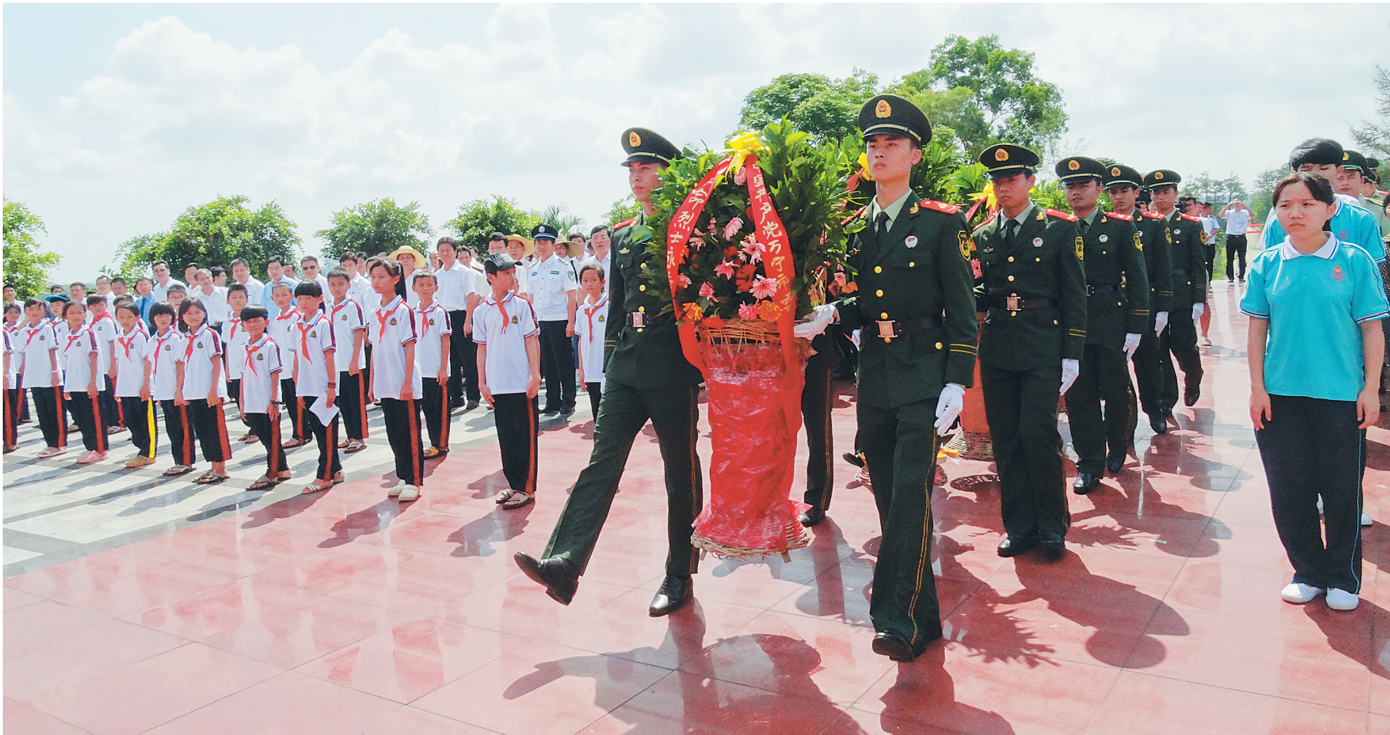
在六连岭革命烈士陵园,万宁市组织举行缅怀革命先烈活动。

战火洗礼,红旗不倒;意志坚定,信念不倒;血肉相连,根基不倒;党徽闪耀,先锋不倒……坐落于万宁的巍巍六连岭,连峰耸翠,这是海南革命根据地的名山之一,是万州“八景”之一,同时也是古万州的屏障。 信念坚定、心系人民、艰苦卓绝、英勇奉献,是六连岭革命精神内涵。从1927年至1950年,23年红旗不倒的革命事迹,记载了人们奋力抗敌的峥嵘岁月。 如今,六连岭精神历久弥新,它所承载的红色记忆已经成为海南人民心中的一座精神家园,激励着人们继续传承和弘扬六连岭精神,为万宁的建设、为海南的发展贡献力量。 万宁市委书记张美文表示,万宁红色文化底蕴深厚、影响巨大,要全力抓好红色文化建设,传承弘扬23年红旗不倒的六连岭精神,提升红色文化的知名度和影响力,从而为建设美好新海南扛起“万宁担当”。 万宁市青少年学生向六连岭革命烈士纪念碑敬献花圈。