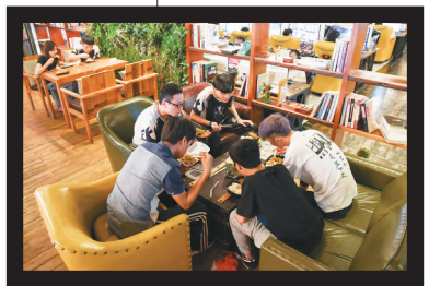
队员们一起吃夜宵