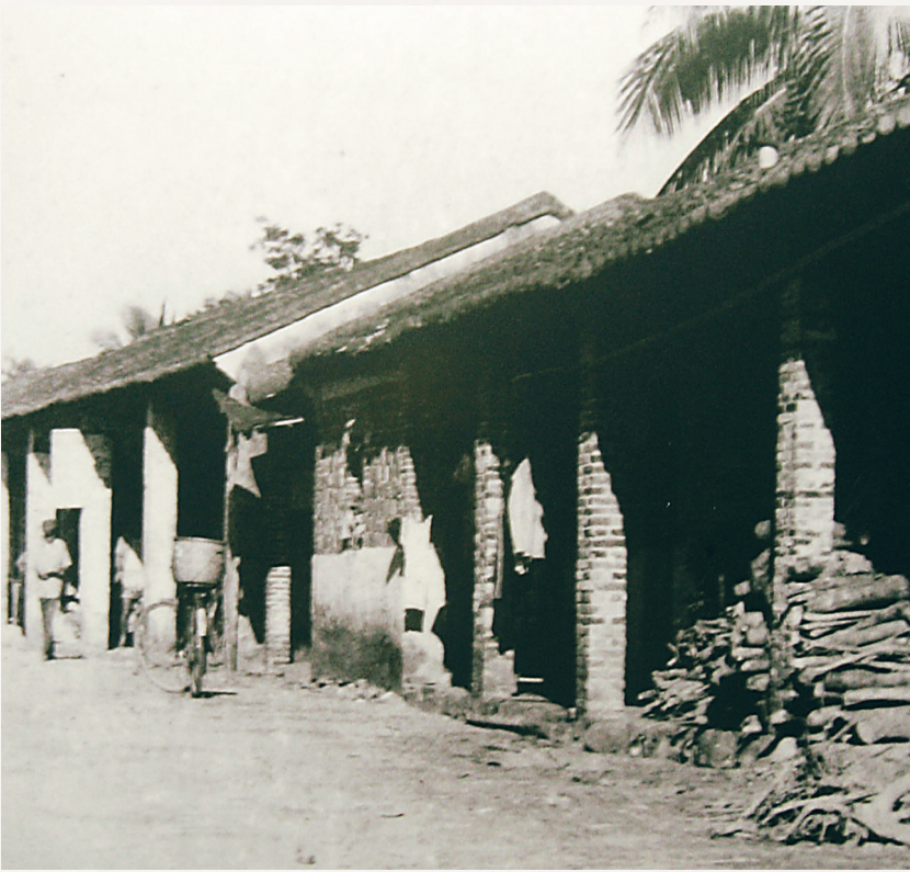
椰子寨战斗遗址 本报记者 李英挺 翻拍