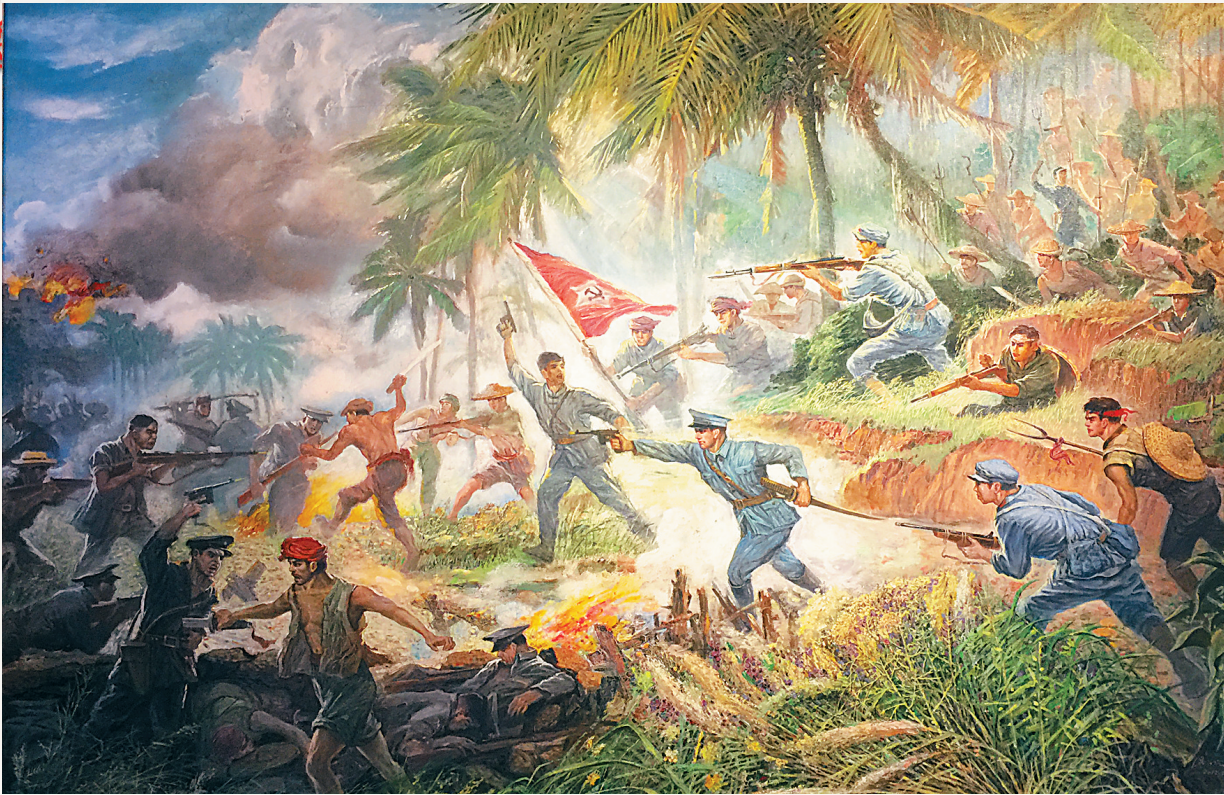
油画《椰子寨战斗》