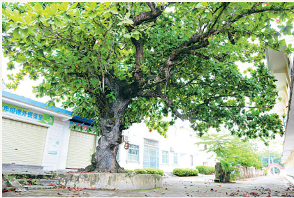
讨逆革命军加所坡作战指挥部旧址

椰子寨战斗在琼崖打响了武装反击国民党反动派的第一枪,成为琼崖“二十三年红旗不倒”历史的开端。