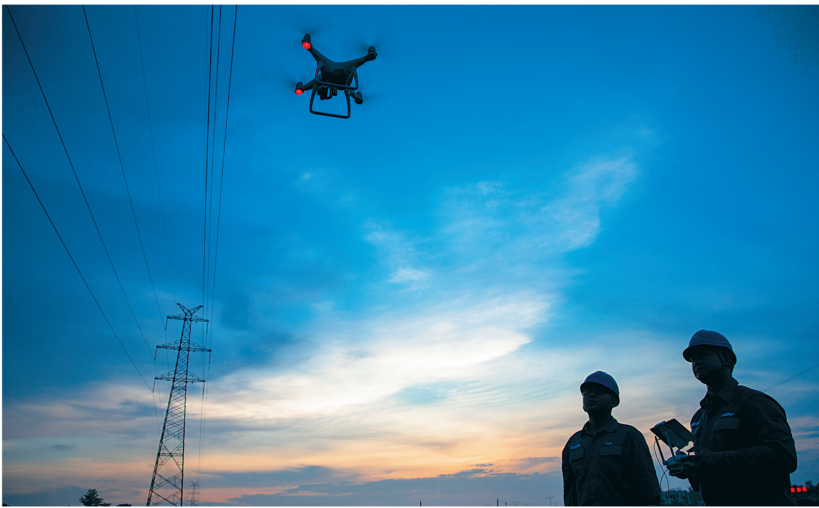
8月1日，南方电网海南海口供电局机巡队的工作人员在操作无人机巡检海口城区的电网线路。南方电网海南公司自去年开始使用无人机巡检输电线路以来，该项巡检工作已趋向常态化。据了解，南方电网海南公司已在海口、三亚、儋州、琼海四个片区配备50多台无人机开展线路巡检工作。截至目前，海南已利用无人机对1744根杆塔、436公里输电线路进行了巡检，大大提高了工作效率。

从源头上提升城市景观照明工程实施效果。目前，海口已编制《海口市景观照明专项规划》，规划范围约230平方公里，将其作为海口“十三五”期间景观照明体系建设的指导性文件。同时，海口已起草《关于加快实施景观亮化工程的意见》和《海口市景观照明管理办法》，将之作为各商业楼宇、住宅小区合理分担城市景观亮化工程建设管理费用、深度参与城市景观亮化工程建设管理的依据。