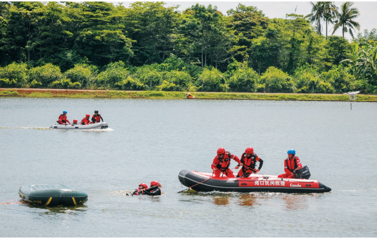
潜水员深入河中搜救伤员的演练场景。