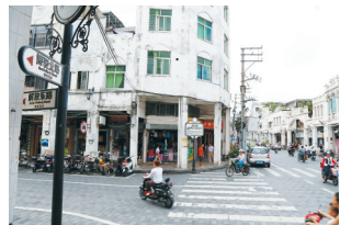
博爱路和解放路两条海口老街的交汇处