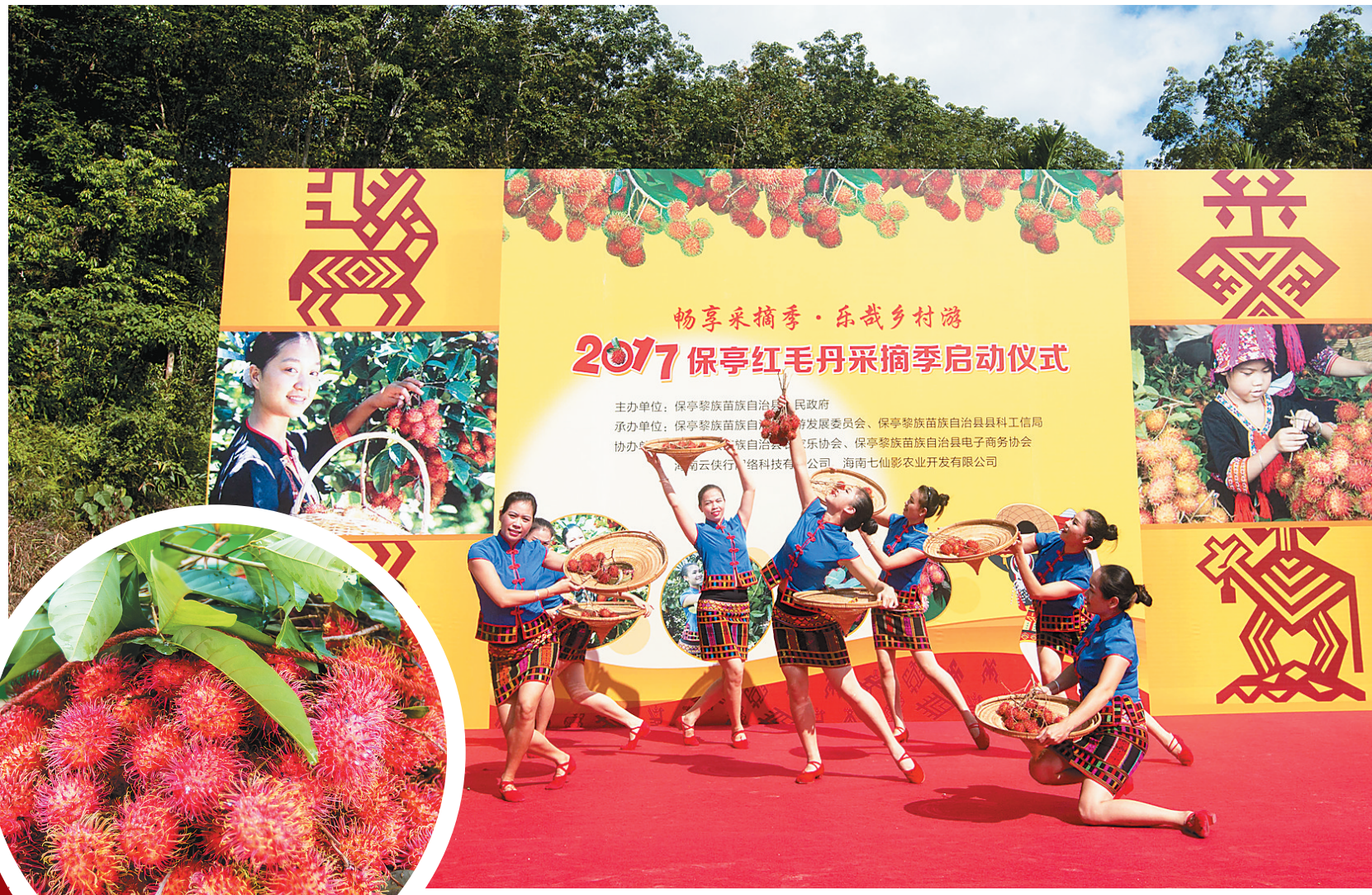
保亭全域旅游红毛丹采摘季活动启动。

据悉,本次活动由保亭县人民政府主办,县旅游发展委员会、县科工信局、县农业局联合承办。