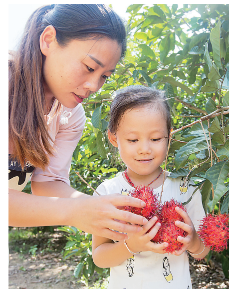
游客在保亭红毛丹种植基地采摘红毛丹。

“为促进农业与旅游相融合,创建保亭休闲农业与乡村旅游品牌,2013年,保亭就推出红毛丹采摘季活动,除了一些散客驾车来采摘,部分旅行社也组团到果园采摘。”保亭旅游委副主任颜春海表示,这种采摘活动是农旅融合发展的有益探索,既丰富了旅游产品内容,又能促进农民增收,深受游客、果农的欢迎。