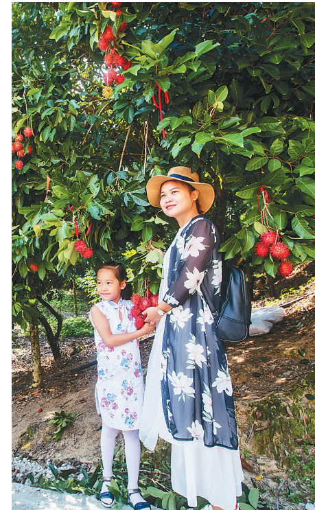
游客在保亭红毛丹果树下拍照。