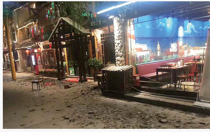
这是九寨沟景区游客中心附近受损的街区。