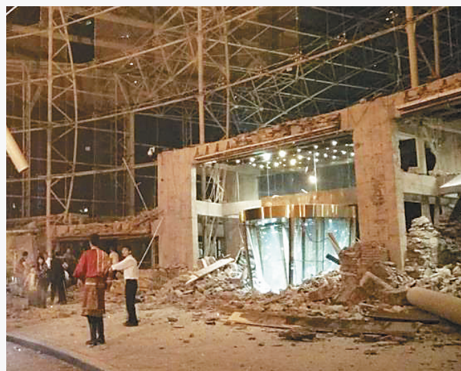
这是九寨沟景区附近受损的酒店大门。