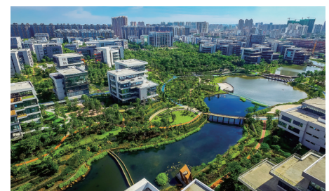
海南生态软件园花园般的办公环境,吸引了众多企业进驻。

充分发挥生态优势,海南互联网产业发展迅速,2016年,全省互联网产业实现营业收入322亿元,互联网企业超过5000家,其中全年营业收入过亿元的达40家。