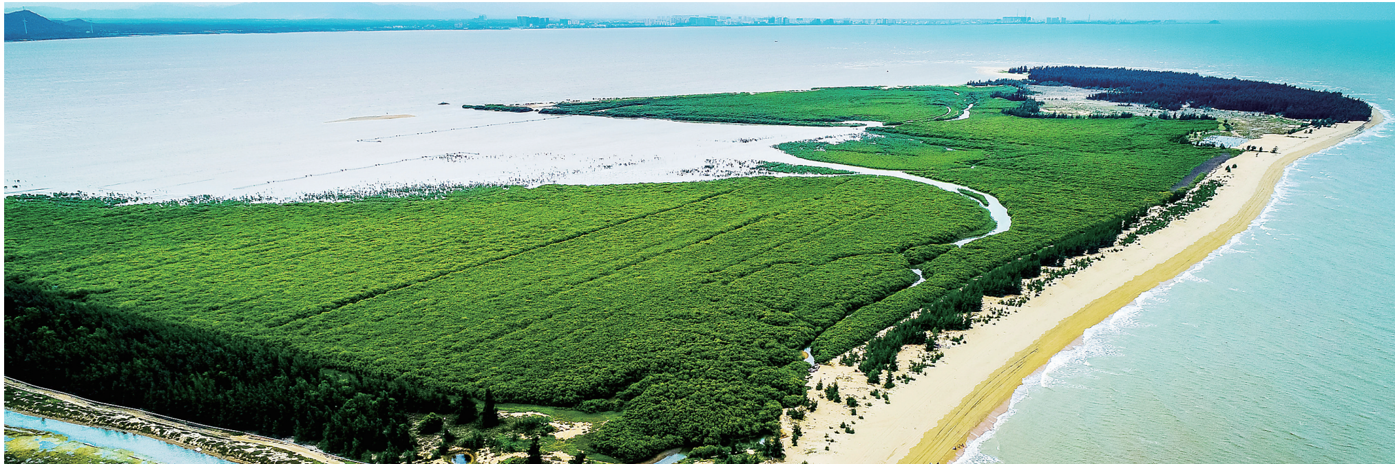
东方市于2014年启动万亩红树林修复工程,对海岸线300米以内范围实施“退塘还湿”“退塘还林”,如今的四心湾千余亩红树林绿意盎然。

A | 一条主线 | 岛之“红” 织就海南生态保护红线密网,建立生态保护红线区底账