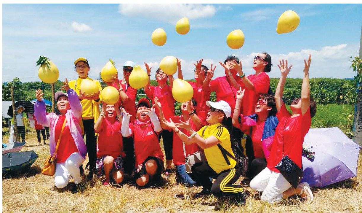
游客采摘红心蜜柚。