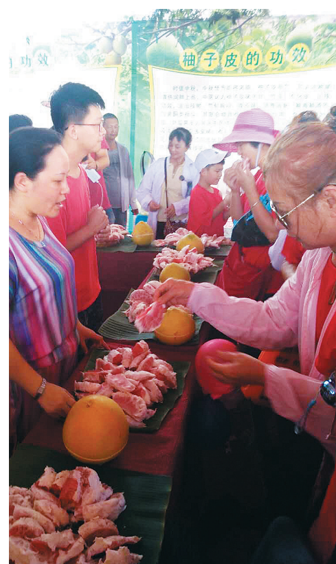
游客品尝红心蜜柚。