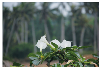
海南乡间常见的白色曼陀罗花。