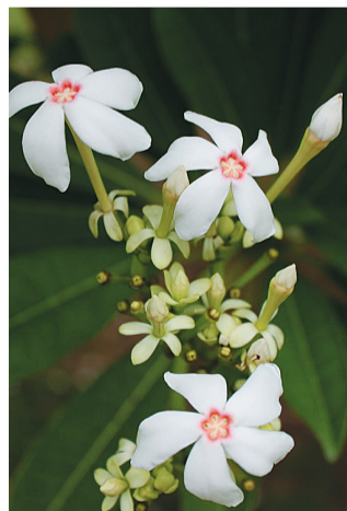
海杧果实和花朵(资料图)