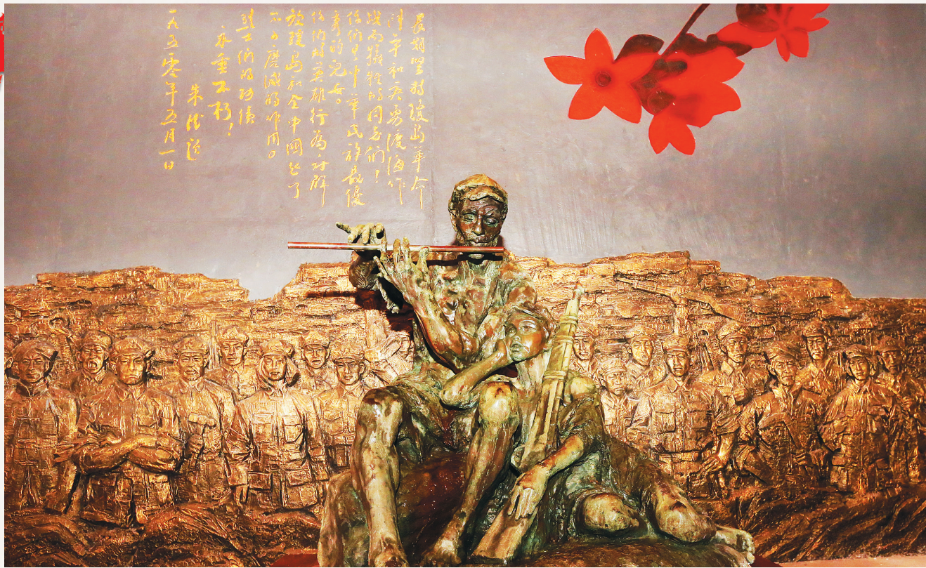
母瑞山革命根据地纪念园,铜塑《艰苦岁月》表现了琼崖红军革命乐观主义精神。