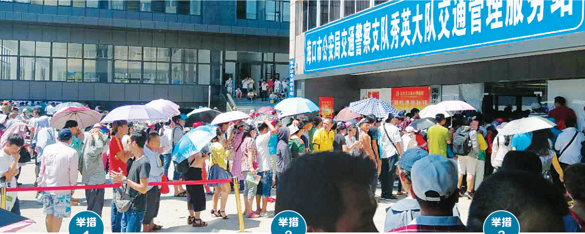
八月十四日,海口市民在海口交警秀英大队交通管理服务点排队给车辆上牌。

9月1日。在此之前,一律予以口头警告教育。有关海口市电动自行车管理措施,海口市交警支队将及时通过“椰城交警”自媒体平台发布,请市民予以关注,并以交警部门发布信息为准。