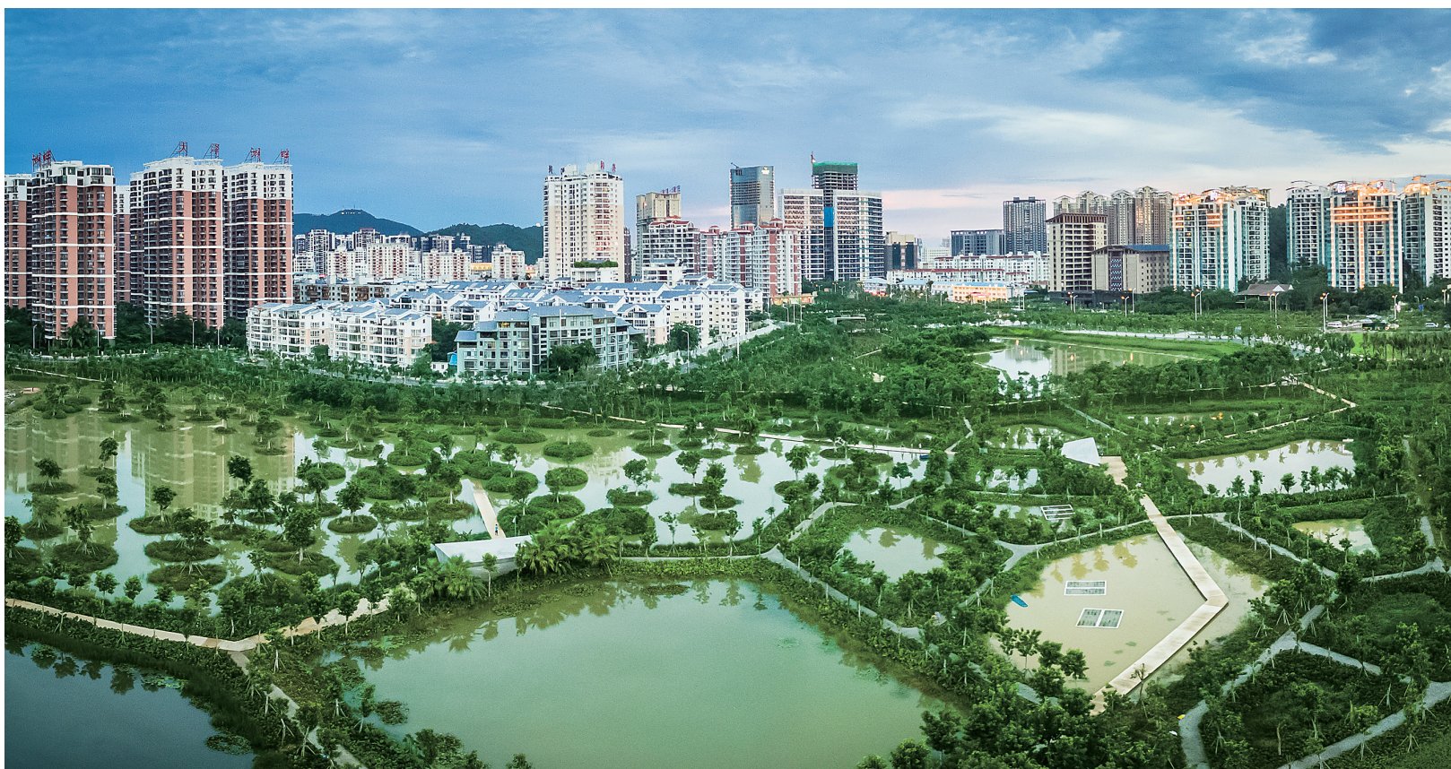
海口、三亚因为优良的生态环境，多次入围中国宜居城市竞争力前十强。图为三亚“双修”项目之一东岸湿地公园初具雏形。

建设生态城市、推进生态文明建设已成为树立城市形象、提升城市竞争力、实现城市现代化的重要途径。从海口“城市更新”、三亚“双修”的“二重唱”，体现了城市发展理念的革新，也凸显出海南已经进入了治理管理与加快发展同等重要的新阶段。