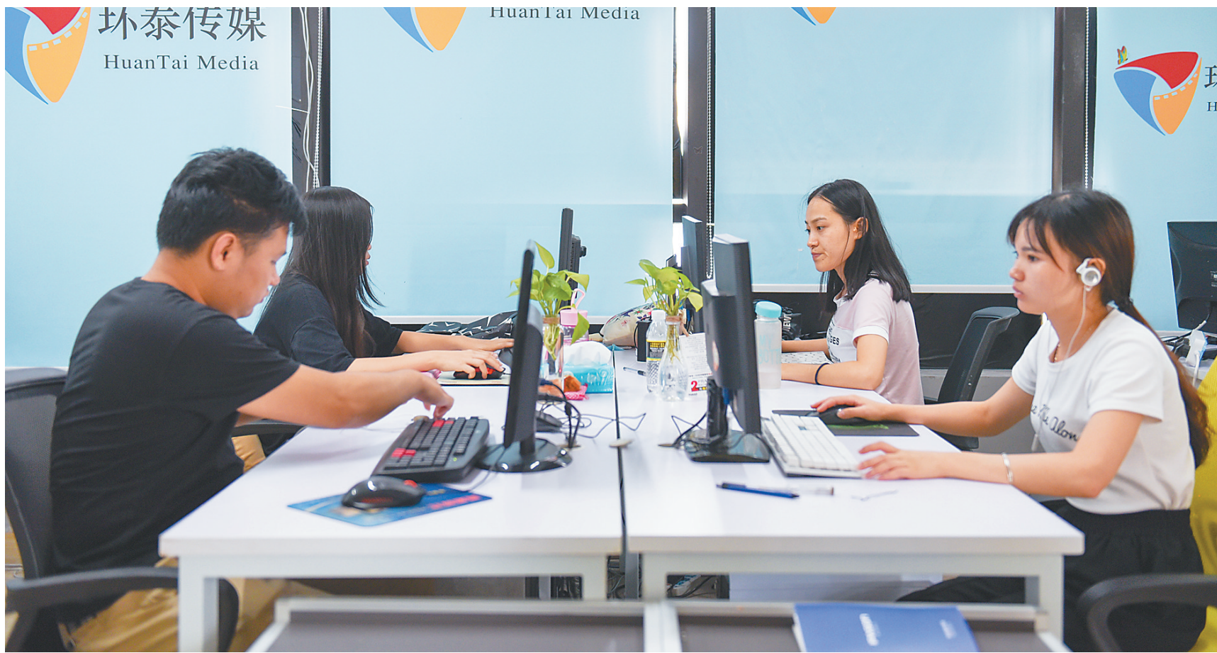
间,年轻人聚集在一起进行文化创意设计。