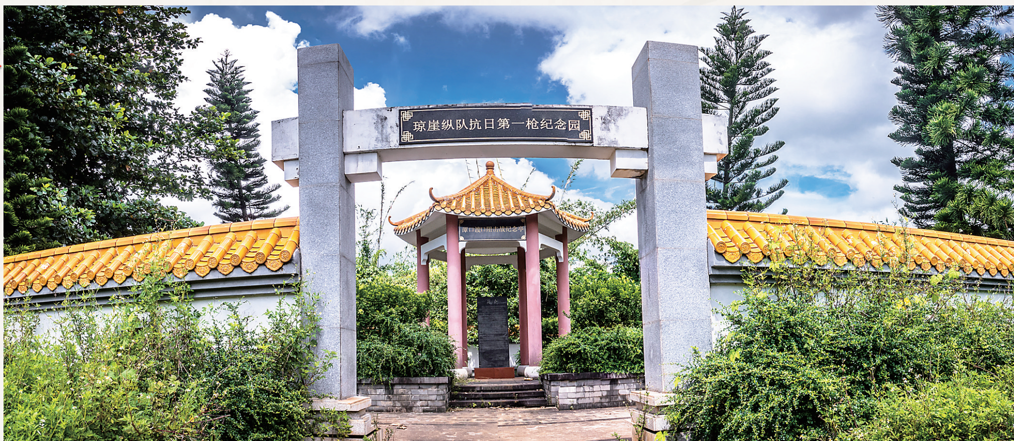
琼崖纵队抗日第一枪纪念馆。