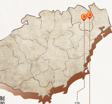
罗牛桥伏击战旧址 琼崖纵队抗日第一枪纪念馆

1939年2月10日凌晨，日寇强行登陆海南岛，琼崖抗日战争爆发。琼崖国民党军队和地方武装仅略作抵抗后撤入山区，共产党领导的抗日武装力量，在敌强我弱的情况下，连续开展了潭口渡口阻击战、罗牛桥伏击战、罗板铺伏击战等多起游击战。游击战不仅打击了日寇侵略琼崖的嚣张气焰，也极大鼓舞了琼崖人民群众抗日斗志，扩大了琼崖抗日队伍的影响。