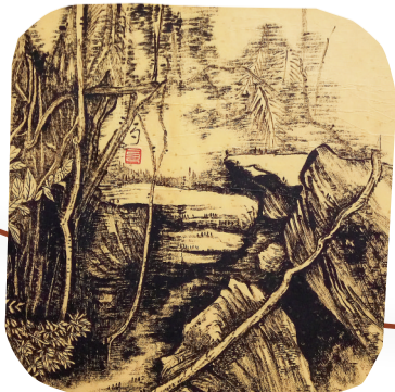
林开盛笔下的海南风貌