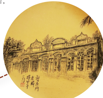
林开盛笔下的海口东门