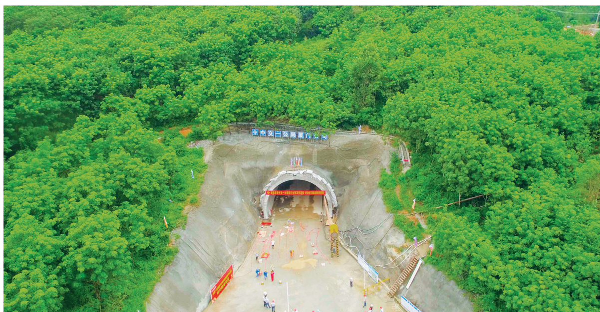
万洋高速A6标段岭门枢纽互通B匝道隧道。本报记者 陈元才 摄

本报营根8月30日电 (记者邵长春 通讯员张璐)日前,万洋高速A6标段岭门枢纽互通B匝道隧道顺利贯通,这是万洋高速开工以来首座贯通的隧道。