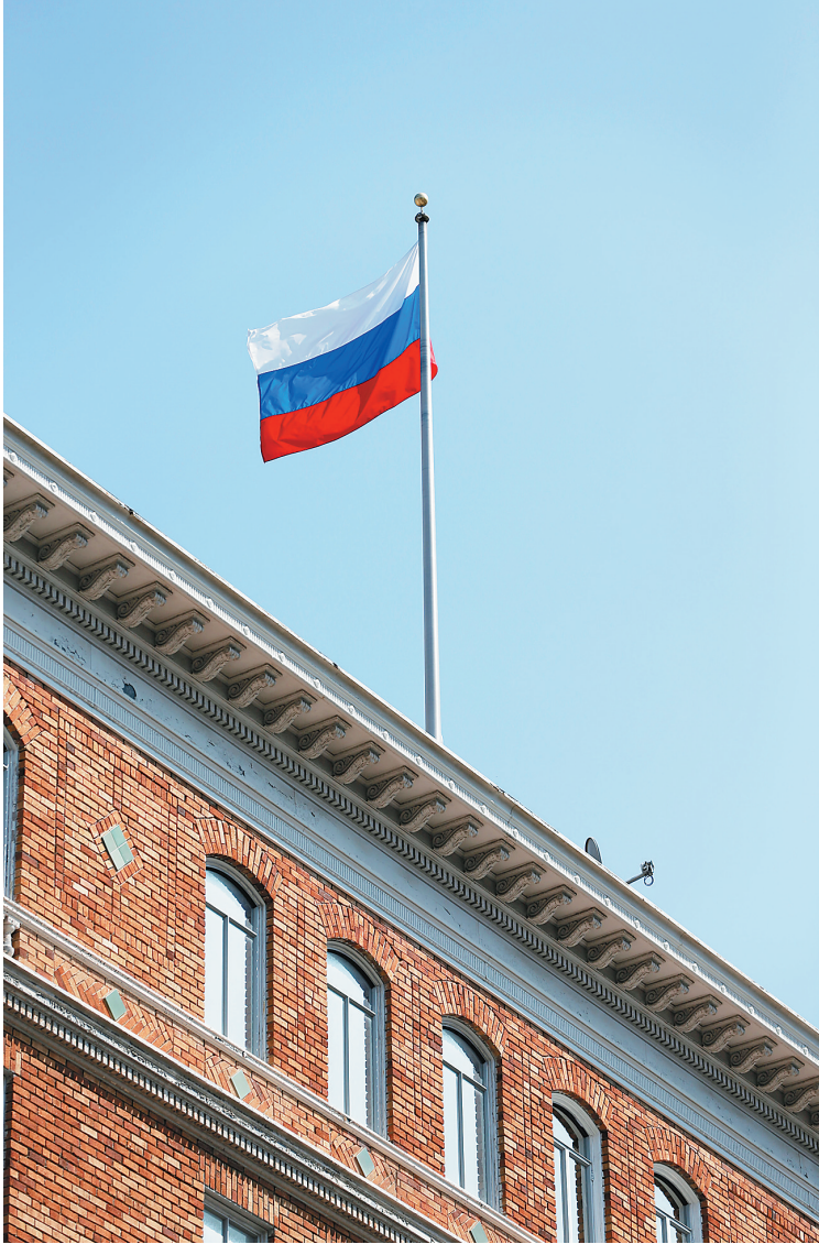
这是8月31日拍摄的俄罗斯驻旧金山总领馆。

交部7月28日称，要求美方将美国驻俄外交人员裁减755人，以使两国在对方国外交机构的人数对等。同时，自今年8月1日起，禁止美驻俄大使馆使用其位于莫斯科西部“银松林”的度假屋及位于莫斯科南部的多个库房。 （据新华社电）