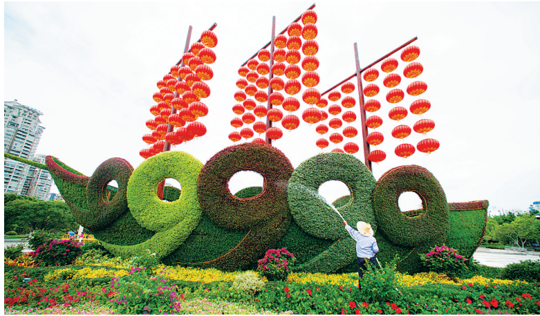
9月2日，工人在厦门白鹭洲公园为花坛浇水。

践了互惠互利、合作共赢的新理念。” 南非全球对话研究所研究员弗朗西斯·科尼盖说，金砖国家已成为一支不断壮大的力量，参与全球治理等重大议题，在国际舞台上发挥日益重要的作用。 当前，面对逆全球化思潮、恐怖主义等诸多挑战，金砖国家更需要加强团结合作，提升在世界事务中的影响力，为世界贡献更多的“金砖方案”。 联合国拉丁美洲和加勒比经济委员会经济事务官员塔妮亚·加西亚·米兰指出，金砖国家在推进全球化进程中必定大有可为。