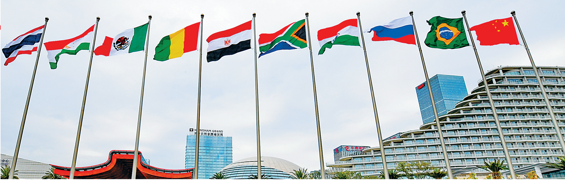
厦门国际会议中心前各国国旗迎风飘扬。