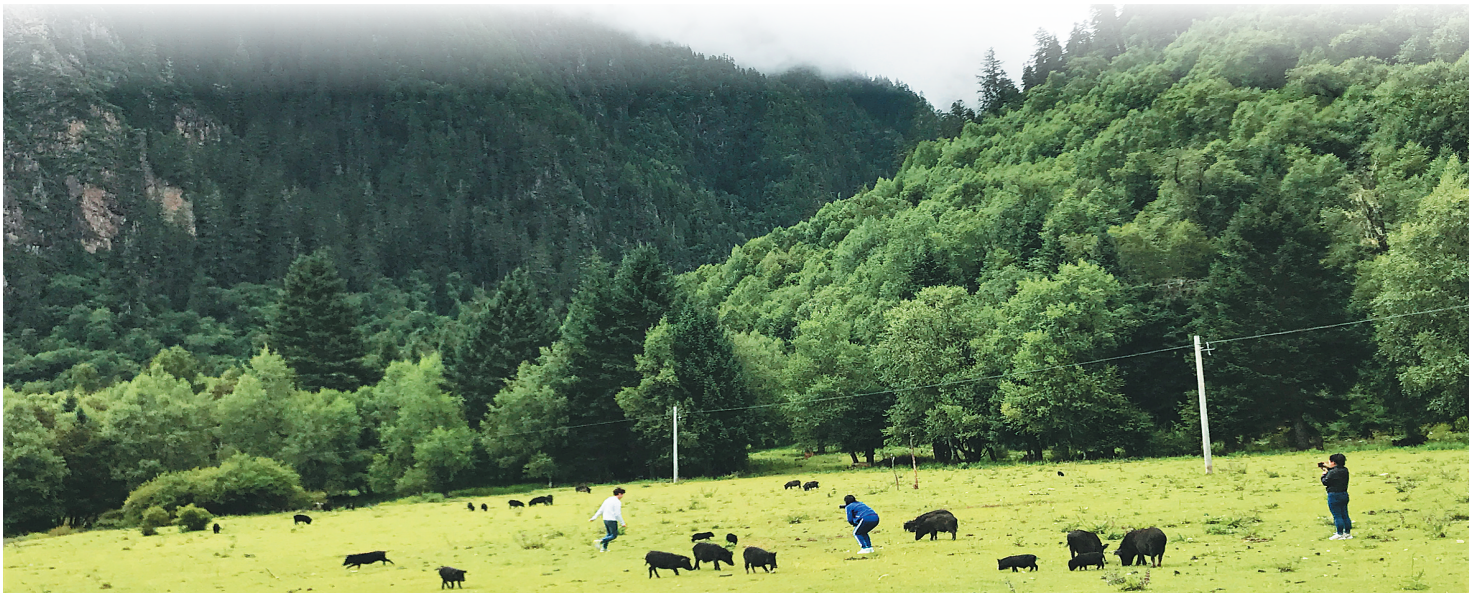
巴松措景区一派田园风光。